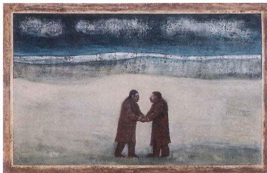
「美しい風のスキマ」 1988年 顔料/パネル 33×51cm

なんでもない風景の中を歩く なんでもない私に カチリ 石英のスイッチが入る 46億年の地球日誌にあらわれる 今日だけの今日の発見