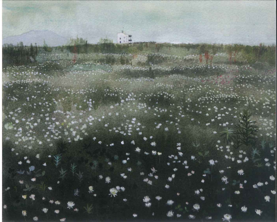
「高田のクローバー」 2015年 アクリルガッシュ/水彩紙 21.8×27cm