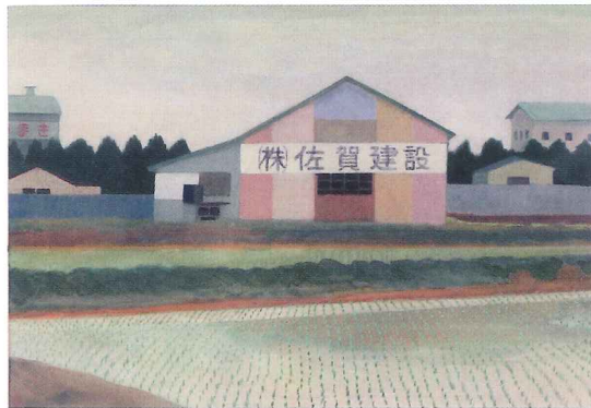
「早緑の頃」 2019年 アクリルガッシュ/水彩紙 32×46.5cm