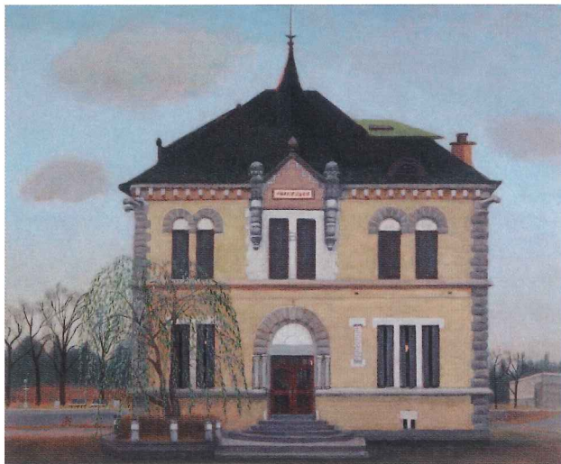
「旧九十銀行」 2018年 アクリルガッシュ/キャンパス F8号