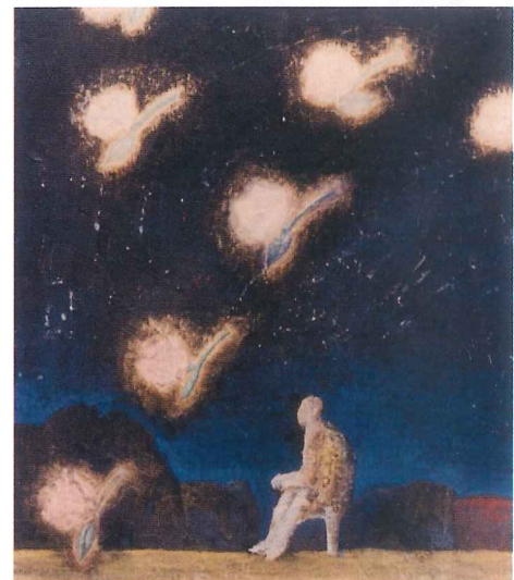
「敷川」 1987年 顔料/パネル 52.8×45.9cm